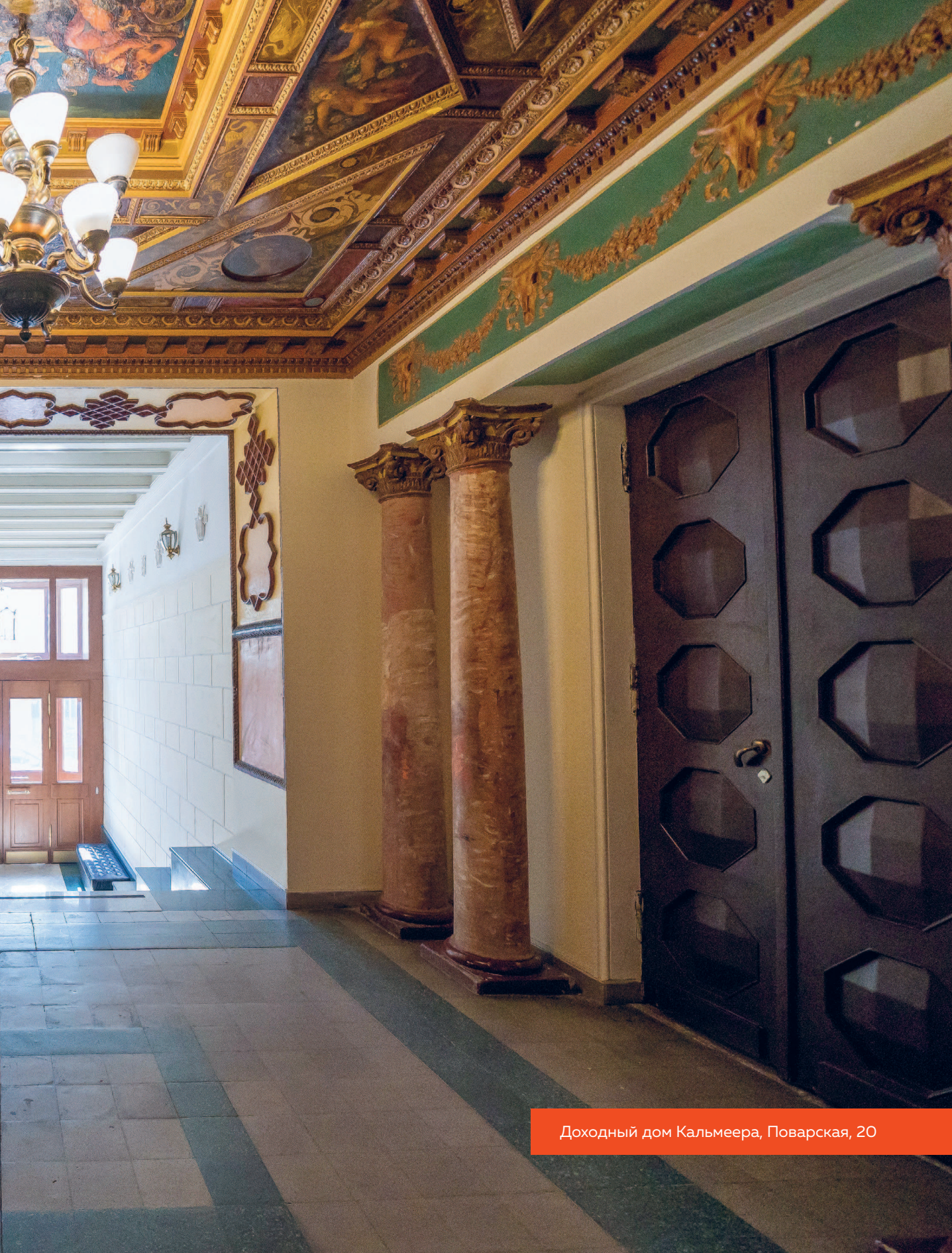
Доходный дом Кальмеера, Поварская, 20