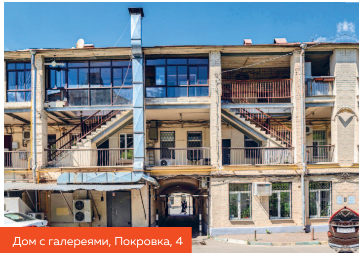
Дом с галереями, Покровка, 4