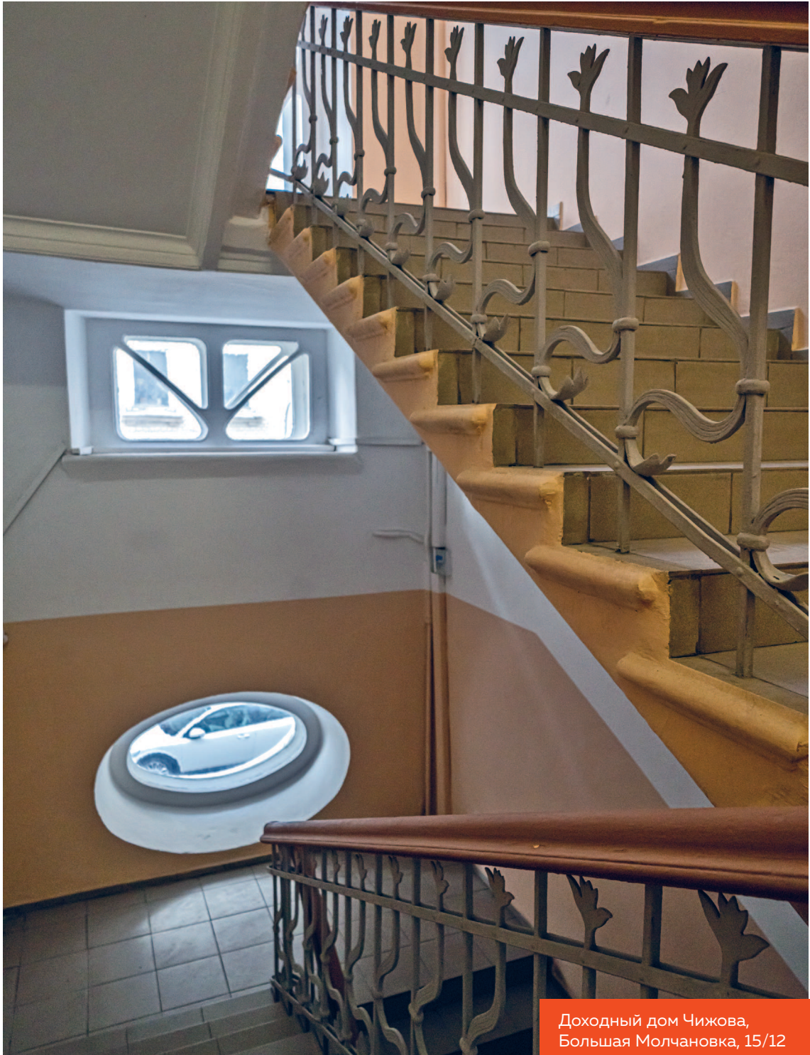
Доходный дом Чижова, Большая Молчановка, 15/12