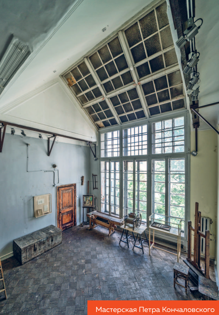
Мастерская Петра Кончаловского

я увидела витражные окна с подобным рисунком (стр. 15). В углу одного из окон примостилась улитка. Витражи были воссозданы по сохранившимся элементам. Уцелели также мраморные подоконники, доломитовые ступени и деревянные профилированные перила.