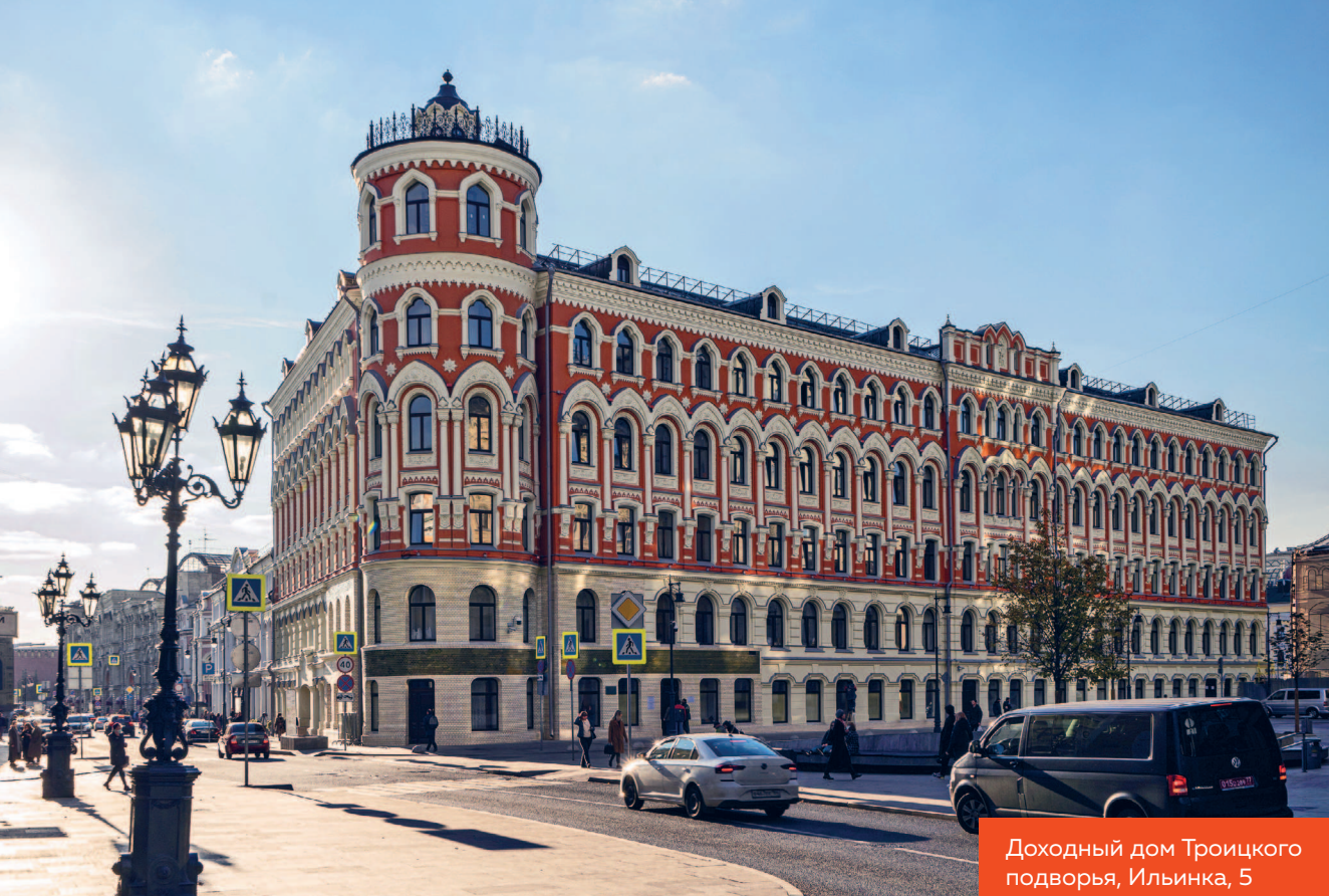
Доходный дом Троицкого подворья, Ильинка, 5