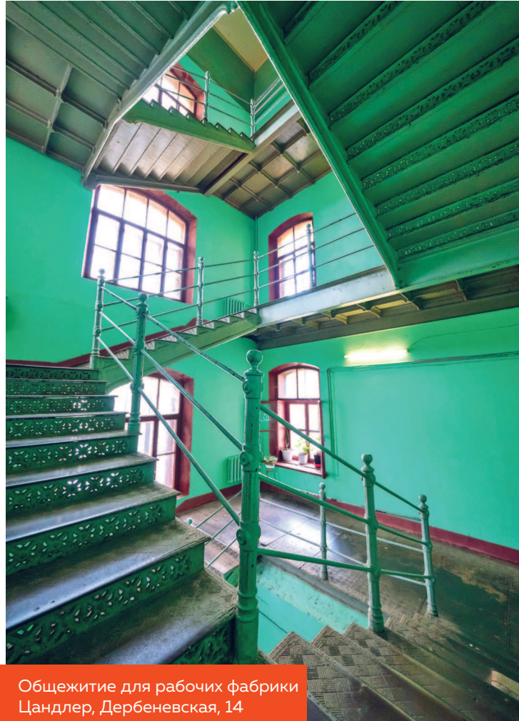
Общежитие для рабочих фабрики Цандлер, Дербеневская, 14

Гнездииковском переулке. В нем было 10 этажей, и на долгое время здание стало самым высоким в Москве.