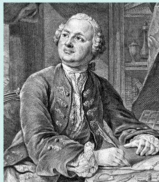
Михаил Васильевич ЛОМОНОСОВ (1711–1765)

Филологические исследования М.В. Ломоносова имеют большое значение для русского языкознания.