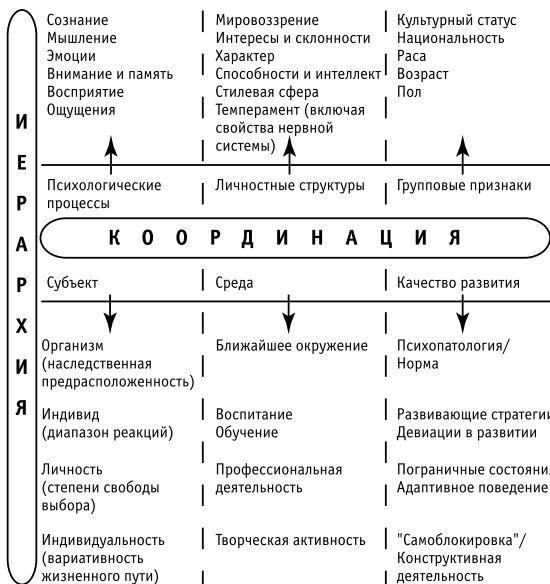
Рис. 1. Концептуальная система координат дифференциальной психологии

Характер учебного пособия, а также ограниченный объем книги вынудили вынести за скобки ряд важных для дифференциальной психологии тем, которые, вместе с тем, получили достаточно подробное освещение в трудах отечественных и зарубежных авторов. Среди них монографии, посвященные психогенетическому анализу механизмов формирования индивидуальных различий (см. Равич-Шербо , 1998), применению математических моделей и статистических методов обработки данных для изучения интра- и интериндивидуальных различий (см. Гусев, Измайлов, Михалевская , 1997), исследованию индивидуальных особенностей младенцев ( Адрианов (отв. ред.), 1993), изучению способностей ( Дружинин , 1995) и мотивации ( Хекхаузен , 1986). Вместе с тем по мере возможности автор стремился показать обоснованность использования психогенетических или нейрофизиологических, а также математико-статистических методов в дифференциально-психологическом исследовании.