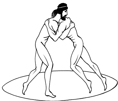
Древние олимпийские игры в Греции. Борьба.

Наиболее достоверной является легенда об основании Олимпийских игр в IX в. до н. э. царем Элиды Ифитом. В те времена междоусобные войны разоряли греческие государства. По совету дельфийского оракула Ифит организовал «игры, угодные богам». На время проведения Олимпийских игр между Ифитом, царем Элиды, и Ликургом, царем Спарты, был заключен договор («о божественном мире»). Этот договор был заключен на 27 Олимпиад, на 108 лет ранее первого официального упоминания об Олимпийских играх 776 г. до н. э. Древнегреческие историки Полибий и Аристодам указывали на то, что только с 27-й Олимпиады имена победителей стали фиксировать. 776 г. до н. э. считается годом проведения 1-й Олимпиады.