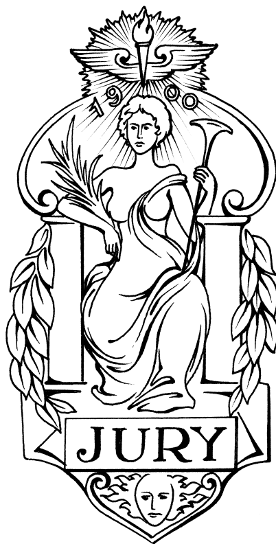
Эмблема II летних Олимпийских игр.