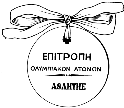
Эмблема I летних Олимпийских игр.