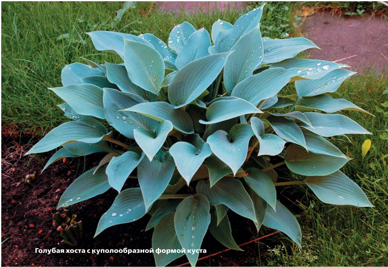
Голубая хоста с куполообразной формой куста