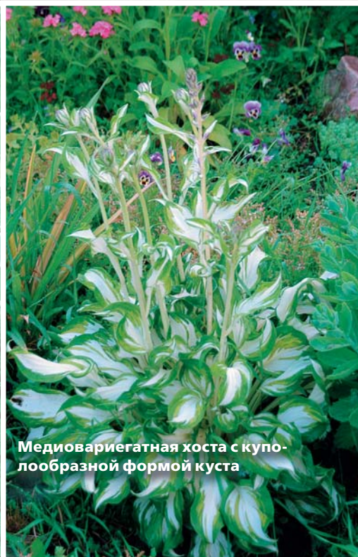
Медювариегатная хоста с куполообразной формой куста