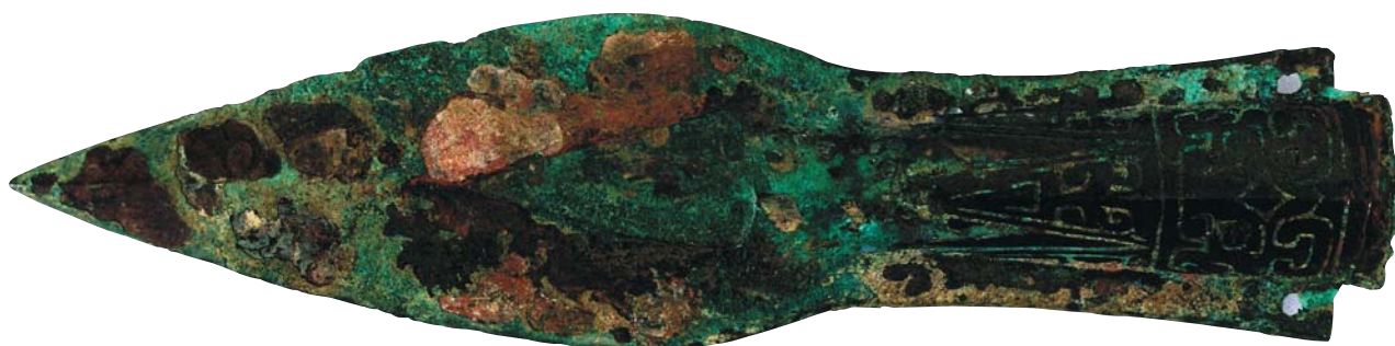
Бронзовый наконечник шанской династии. (Британский музей ОА 1953.12-15.2)

собой примитивный этап в эволюции связей с другими народами, когда ресурсы других сообществ, находящихся на более низком техническом уровне, использовались на манер охотничьей добычи. Фактически охотничьи вылазки и военные кампании были организованы одинаковым образом, и различие между ними часто было неопределенным.