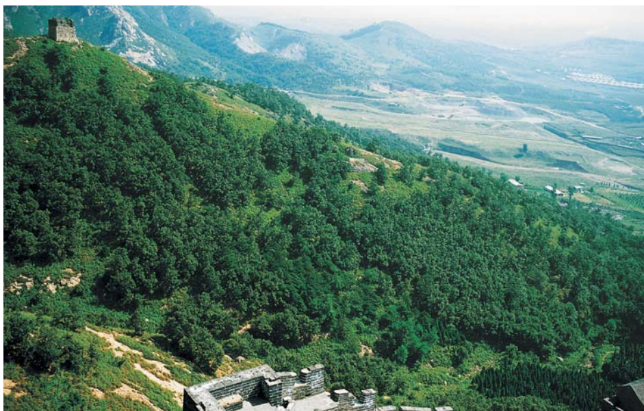
Вид с горы Цзяошань на равнины Северного Китая

руководство, которое было бы одновременно кратким и полезным. Китайская фонетика сильно изменилась с течением веков, в своем современном виде она использует систему тонов, которую не способен воспроизвести наш алфавит. Я сохранил модифицированную систему транскрипции Уэйда-Джайлза, наиболее распространенную в исследовательских работах, несмотря на возражения, выдвигаемые системой пиньин, которую предпочитает нынешнее правительство. Слова, транскрибированные по системе Уэйда-Джайлза, более приемлемы для англоговорящего читателя, и когда их произносят так, как если бы они были английскими, получают результат, хотя и не абсолютно точный, но по крайней мере опознаваемый. Таким образом, мы во всяком случае избежим распространенных нелепостей вроде « Kwin » для обозначения династии Ch'in (Цинь), основанной Шихуанди (на пиньин пишется Qin , но произносится близко к английскому « chin »). Однако даже внутри этих систем не всегда соблюдается последовательность, и читатели должны знать, что названия народов, географических мест и династий могут появиться в других работах в иной форме. Так, и государство Восточное Чжоу, которое я называю Tsin , и гораздо более поздняя династия Kin , основанная народом чжурчжэней, обозначаются в некоторых английских работах как « Chin ». В тех случаях, когда в опубликованных работах появляются разные варианты, я выбирал тот, который дает меньше оснований для путаницы*.