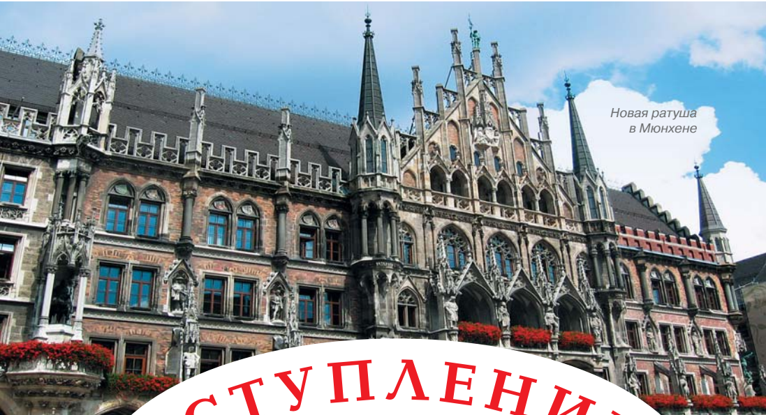
Новая ратуша в Мюнхене