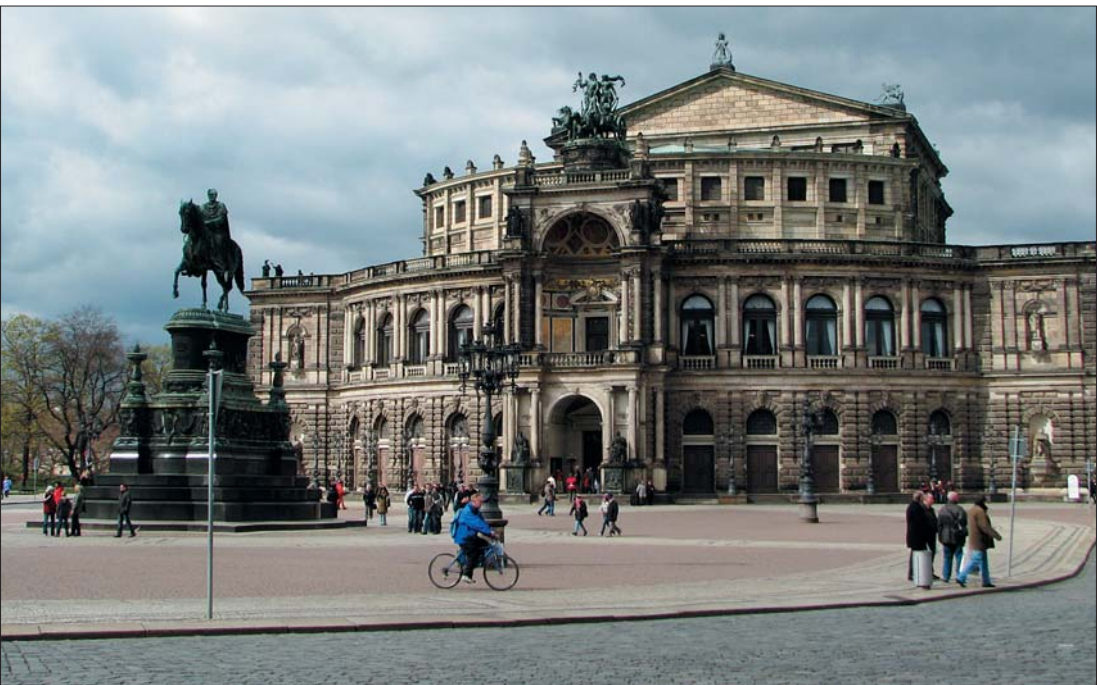
Оперный театр в Дрездене

Впрочем, Германия — далеко не рай, и за глянцевым фасадом она совершенно другая. Обычная страна со всем странам присущими проблемами, и далеко ей как до знакомого нам с детства идеала «Прекрасного Далека», так и до рекла-