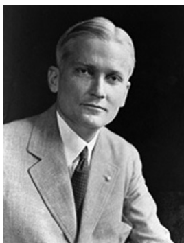
Рис. 1.9. Сенатор Хирам Бингхам III — первооткрыватель «потерянных городов инков»

Существовали ли реальные археологи, подобные Индиане Джонсу? Вполне возможно, что какие-то искатели приключений проникали вглубь перуанских джунглей в поисках сокровищ.