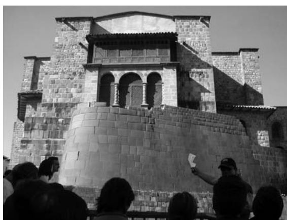
Рис. 1.2. Храм Солнца Кориқанча

Солнца, или Кориқанча (Coricancha), что означает «Золотой двор» на языке кечуа (quechua), которым пользовались инки. Идолы из всех завоеванных инками провинций хранились в храме Кориқанча (рис. 1.2). Считается, что золота было так много, что им были покрыты даже стены и пол храма. Двор храма Солнца был уставлен золотыми статуями, а в самом храме хранилось множество священных идолов.