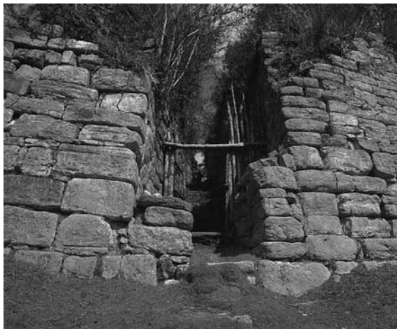
Рис. 1.3. Руины крепости Куелап

цветами и узорами, точно, как в фильме Индиана Джонс. В поисках утраченного ковчега .