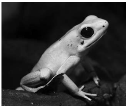
Рис. 1.8. Золотая ядовитая дротиковая лягушка Phyllobates terribilis

Под белой пеной находится слой ядовитой желтой маслянистой жидкости, которую индейцы сохраняют для последующего использования. Эта жидкость остается токсичной в течение полугода.