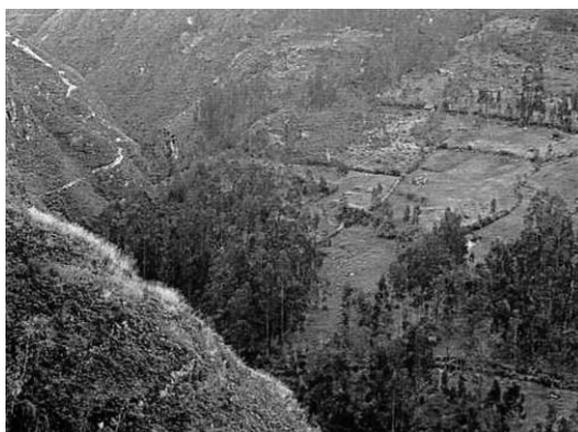
Рис. 1.1. Вид на Амазонас с высоты птичьего полета

Украденный Индианой идол был настолько священным, что по законам племени индейцы готовы были убить вора. В действительности такое индейское племя, вероятно, могло находиться в области обитания народа чачапояс (chachapoyas), живущего в Амазонских Андах, или Амазонас (Amazonas), в северной части Перу (рис. 1.1). Область Амазонас граничит с Эквадором на севере, а ее столица называется Чачапояс по имени индейского племени. Анды — самые высокие горы в мире, за исключением гор в Азии. Именно в таких высокогорных районах обитают индейцы чачапояс, которых называют также «Воинами облаков». Они занимаются охотой и собирательством в покрытых облаками влажных вечнозеленых лесах.