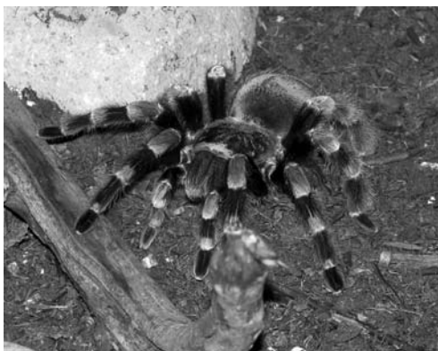
Рис. 1.4. Тарантул Brachypelma smithi

Но прежде всего давайте выясним, что же такое тарантул. Это паук семейства Theraphosidae с несколькими ногами ( tarsus ), двумя клешнями и подушечками ( scapulae ) (рис. 1.4). Эти пауки – огромные и волосатые создания. В настоящее время известно около 800 видов тарантулов, и все они являются наземными хищниками. В основном тарантулы охотятся на насекомых, хотя некоторые крупные тарантулы могут нападать на мышей, птиц и ящериц. Несмотря на угрожающий внешний вид, укусы большинства видов тарантулов не опасны для людей и, тем более, не смертельны.