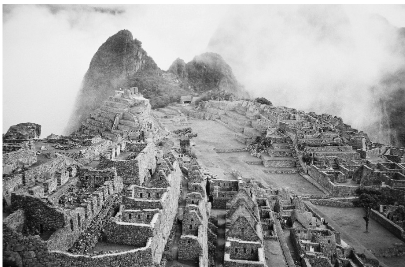
Рис. 1.10. Вид на Мачу-Пикчу