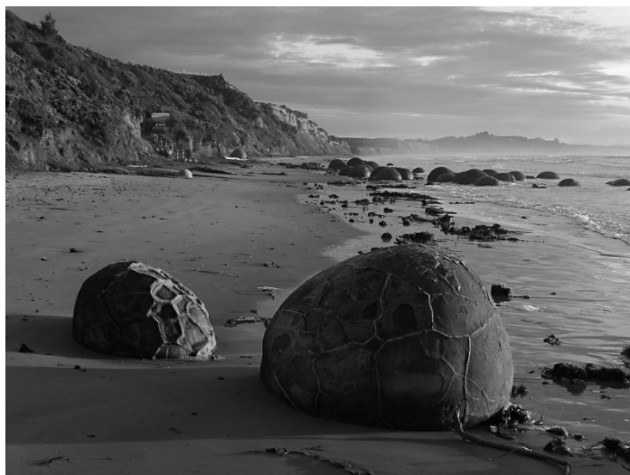
Рис. 1.6. Огромные сферические камни Моераки

Boulders) обнаружены на пляже Коекохе-Бич (Koekehe Beach) региона Отаго (Otago) на побережье Новой Зеландии (рис. 1.6). Согласно местной легенде эти сферические булыжники являются остатками огромных сосудов из высушенной и выдолбленной картошки кумара и бутылочной тыквы, а также больших корзин, которые использовались рыбаками для ловли угрей. Говорят, что эти обломки были выброшены морем на берег после крушения гигантского каноэ Араи-те-уру (Araite-uru). Около одной трети камней Моераки имеют диаметр от 0,5 до 1 м, а две трети – от 1,5 до 2,2 м. Практически все булыжники имеют сферическую форму.