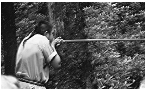
Рис. 1.7. Кадр видеоролика, демонстрирующего процесс стрельбы из духовой трубки

Дротики имеют вид заостренных стержней со спиральным наконечником, покрытым ядом. Обычно их выстреливают с помощью духовой трубки, сделанной из тростника (рис. 1.7). Длинный ствол духовой трубки вырезался из цельного куска тростника. Иногда в него вкладывался ствол тростника меньшего диаметра, чтобы сделать канал уже. На один из концов надевался деревянный мундштук. Некоторые духовые трубки достигали длины 4 м. Посланный таким оружием дротик мог пролететь до 100 м и с высокой точностью попасть в жертву.