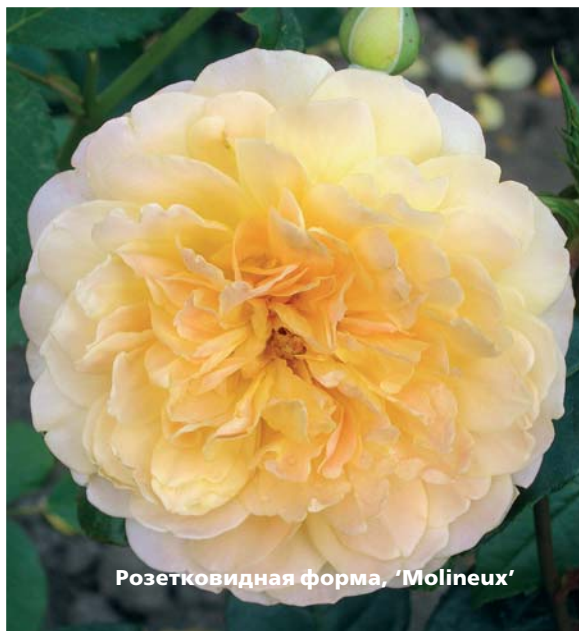
Розетковидная форма, 'Molineux'