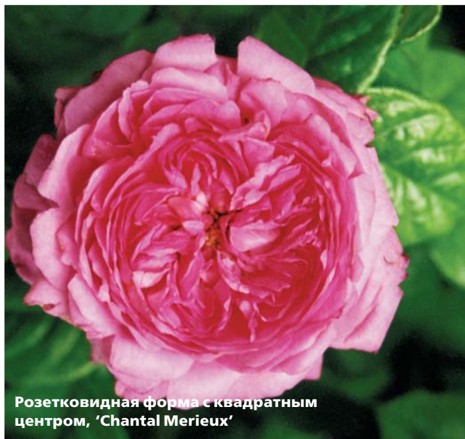
Розетковидная форма с квадратным центром, 'Chantal Merieux'