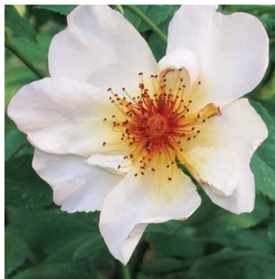
Простой цветок, 'Golden Wings'

Цветки у роз простые, обоеполые, состоящие из пяти чашелистников и лепестков. В центре цветка располагаются выступающие наружу тычинки, а пестик спрятан вовнутрь, в цветоложе.