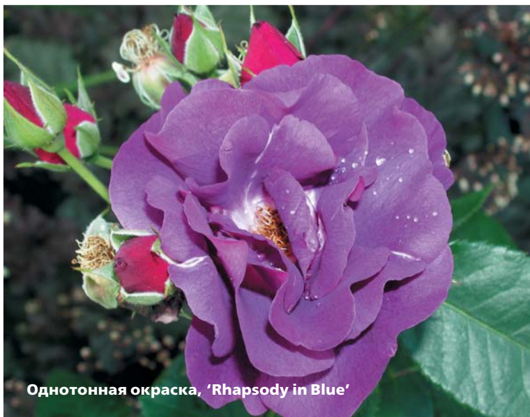
Однотонная окраска, 'Rhapsody in Blue'