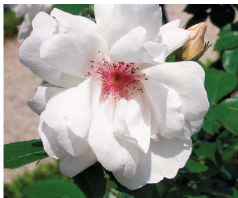
Полумахровый цветок, 'Jacqueline du Pre'