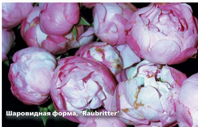
Шаровидная форма, 'Raubritter'