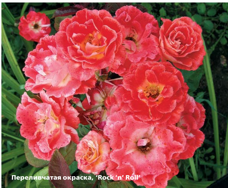
Переливчатая окраска, 'Rock 'n' Roll'