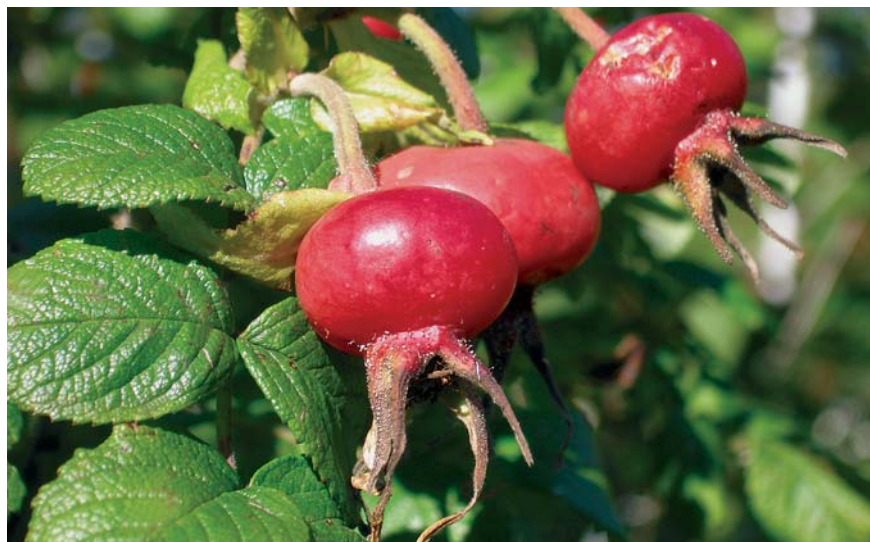
Плоды Rosa rugosa

Плоды некоторых видов и гибридов не только широко используются в медицинской и пищевой промышленности, но и служат украшением осенних цветников и оригинальных букетов.