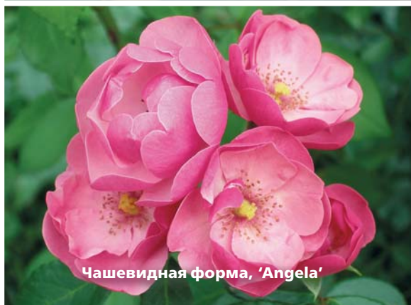
Чашевидная форма, 'Angela'