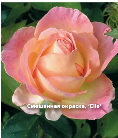
Смешанная окраска, 'Elle'