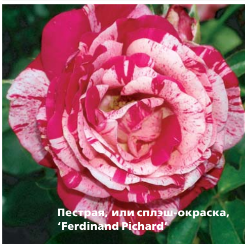
Пестрая, или сплэш-окраска, 'Ferdinand Richard'