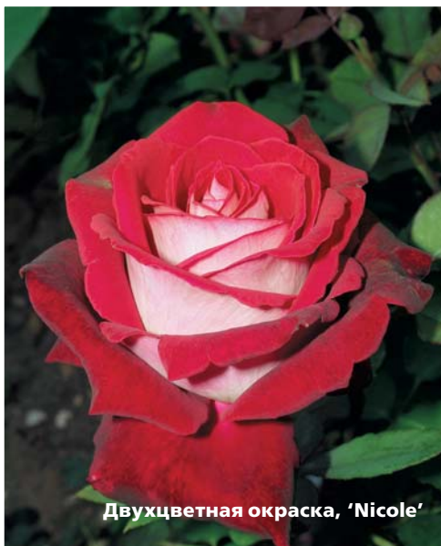
Двухцветная окраска, 'Nicole'