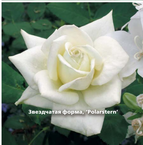
Звездчатая форма, 'Polarstern'