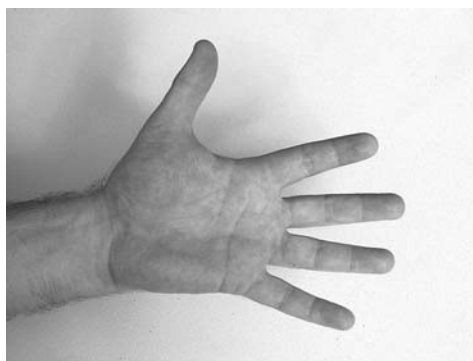
1 | Ладонная сторона кисти руки

Классический массаж включает в себя 9 групп приемов: поглаживание, выжимание, разминание, вибрацию, растирание, активные и пассивные движения, движения с сопротивлением, ударные приемы, встряхивание.