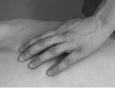
13 | Прямолинейное растирание