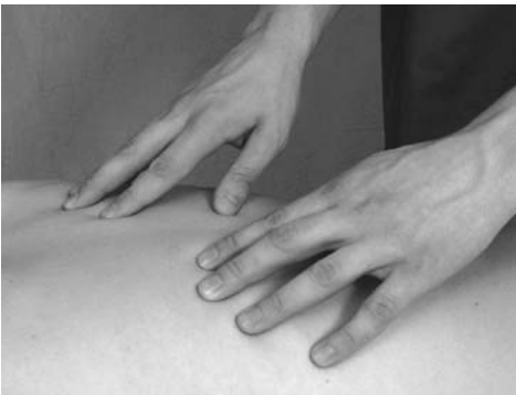
15 | Круговое попеременное растирание

тирание опорной частью кисти (рис. 14) применяется при массаже крупных мышц: спины, ягодиц, бедер. Данный прием необходимо проводить таким об-