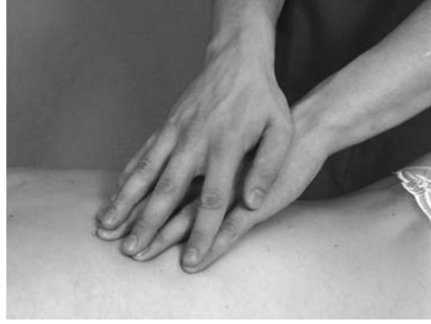
16 | Круговое растирание с отягощением