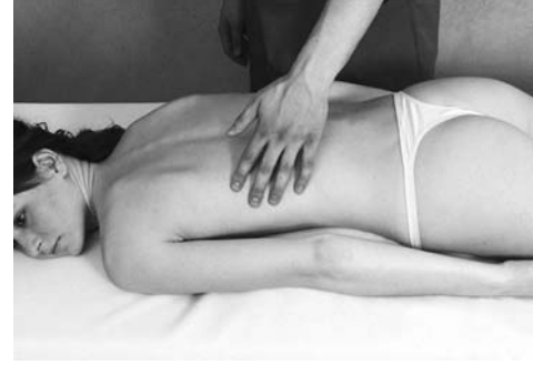
10 | Граблеобразное поглаживание

для массирования больших мышечных пластов. Дополнительное давление создается наложением одной кисти на другую.