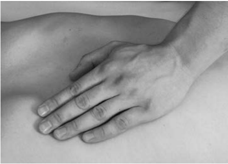
14 | Растирание опорной частью кисти

тирание опорной частью кисти (рис. 14) применяется при массаже крупных мышц: спины, ягодиц, бедер. Данный прием необходимо проводить таким об-