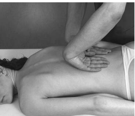
6 | Глажение