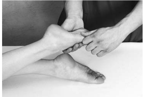
12 | Щипцеобразное поглаживание

ные движения осуществляются большим, указательным и средним пальцами, сложенными щипцеобразно.