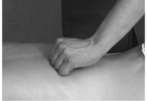
11 | Гребнеобразное поглаживание

Для глубокого массирования крупных мышц в области спины и таза используется гребнеобразное поглаживание (рис. 11), которое проводится костными выступами фаланг пальцев, полусогнутых в кулак. Для массажа сухожилий, стопы, кисти, пальцев и небольших мышечных групп используется щипцеобразное поглаживание (рис. 12), при котором поглаживающие прямолиней-