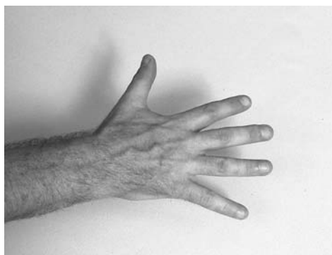
2 | Тыльная сторона кисти руки

Основными приемами являются поглаживание, растирание, разминание, вибрация и выжимание. Остальные приемы являются вспомогательными, усиливающими действие основных и помогающими добиться максимального эффекта от массажа.