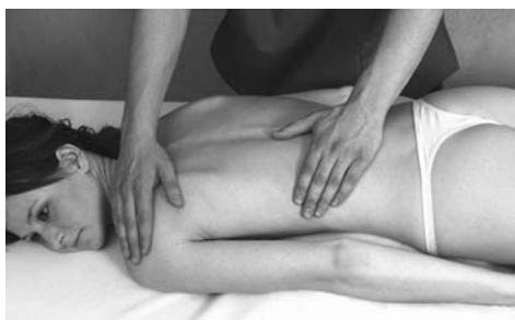
5 | Поглаживание в перпендикулярном направлении