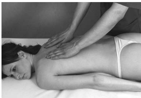
4 | Прямое поглаживание

глаживание (рис. 4) и поглаживание в перпендикулярном направлении (рис. 5). Поглаживание тыльной стороной кисти (рис. 6) называется глажением.