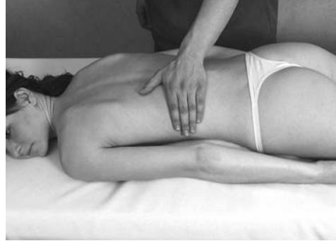
9 | Обхватывающее поглаживание

Глубокое поглаживание (рис. 7) может производиться не только ладонью, но и тыльной или боковой поверхностью одного или нескольких пальцев, а также локтевым краем кисти и опорной поверхностью ладони. Усилия при поглаживании способствуют выведению из тканей продуктов метаболизма и шлаков.