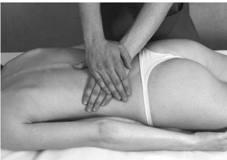
8 | Поглаживание с отягощением

Поглаживание с отягощением (рис. 8) рекомендуется использовать на обширных участках тела с избыточным подкожным жировым слоем, а также