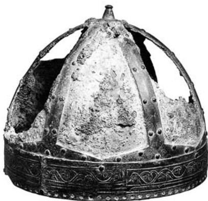
Шлем. Южная Франция, V век.

К V—VI векам тактика ведения боевых действий франков не сильно изменилась, как и прежде, основной силой являлось пешее войско. «Едва ли у них (франков) есть конница», — писал в VI веке греческий историк Агафий. «У них есть щиты, топоры и мечи, но практически нет луков и пращей. В качестве метательного оружия они используют топоры и дротики с зазубренными наконечника-