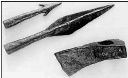
Оружие франков: наконечник дротика, наконечник копья и метательный топор — франциска. Западная Европа, V век.

ми (ангоны). Дротики не очень длинные, их можно метать и наносить колющие удары (ангоны франков происходят от римских пилумов). Наконечник дротика имеет длинную втулку, которая почти полностью закрывает древко. В бою они метают эти дротики в противника. При попадании в человека зазубренный наконечник этого дротика так прочно застревает в теле, что извлечь его очень сложно. Если дротик попал в щит, то выдернуть его практически невозможно, даже сломать или срубить его не представляется возможным, так как древко защищено металлической втулкой. Метнув дротики, франки, опустив свои щиты, сразу же атакуют противника, пока тот находится в замешательстве после обстрела дротиками». Кстати, в Британии в V веке первые столкновения англов и саксов также начинались с бросания дротиков и другого метательного оружия, после чего оба пеших войска сходились в рукопашном бою. Особенно популярна в то время была так называемая «стена щитов», которую применяли не только в оборонительных целях.