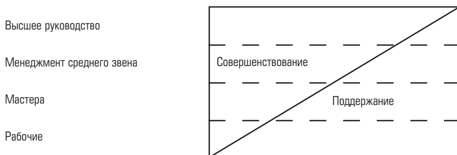
Рис. 1-1. Японское восприятие должностных функций

Кайдзен — это небольшие усовершенствования в результате постоянных усилий. Инновация предполагает резкое улучшение в результате значительных вложений средств в новые технологии или оборудование. (Если для вас деньги — ключевой фактор, учтите: инновации обходятся дороже.) В силу своего пристрастия к инновациям западные менеджеры упускают